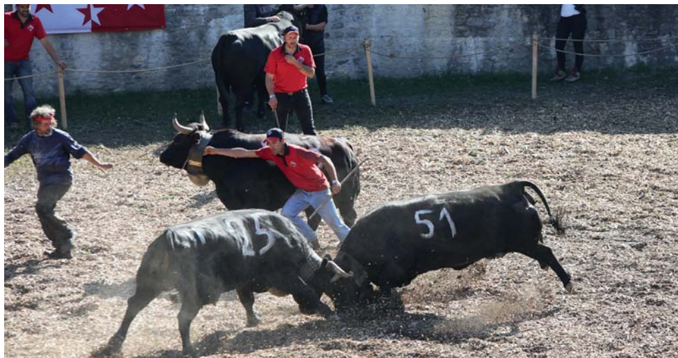
Promesse et Pagaille dans une lutte acharnée, grâce au travail des rabatteurs. Une bonne organisation par le syndicat d'élevage, la laiterie et la caisse d'assurance du bétail d'Isérables.