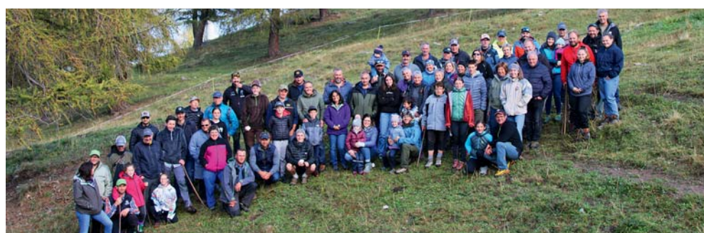
Alpants de la Combyre.