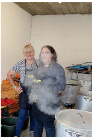
Sans patates, pas de raclette.