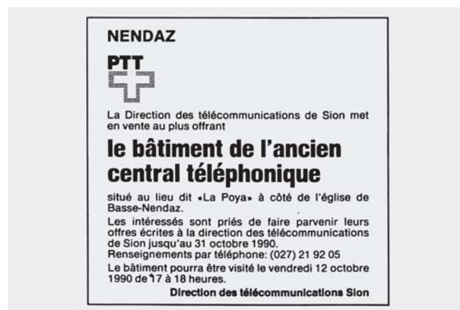
La vente du bâtiment de l'ancien central téléphonique, Nouvelliste, 5 octobre 1990.

C'est en 1962 que les PTT-Postes Télégraphes et Téléphones – avaient mis en fonction le central téléphonique ayant une capacité de 200 raccordements. En tant que tel, il fut abandonné en 1973, lors de la mise en service d'un centre de gravité des raccordements téléphoniques aux Bouillets par la DAT et mis en vente en 1990. La paroisse se porte acquéreuse et le 3 octobre 1993, à la patronale de la Saint-Léger, on inaugure la nouvelle salle paroissiale de 70m 2 .