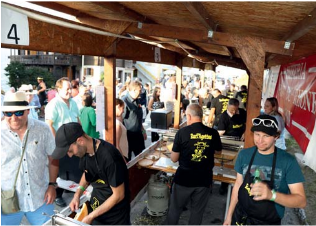
Les raclleurs en pleine action.