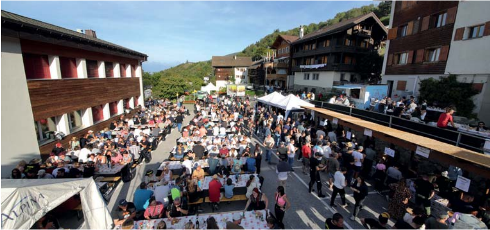
Le beau temps était de la partie pour accueillir du monde ce samedi 30 septembre.