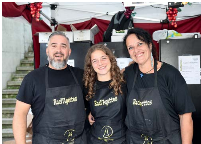
Les bénévoles des bars, indispensables!