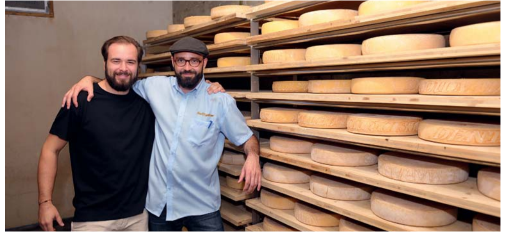
La cave des fromages, provenant de 9 alpages différents.