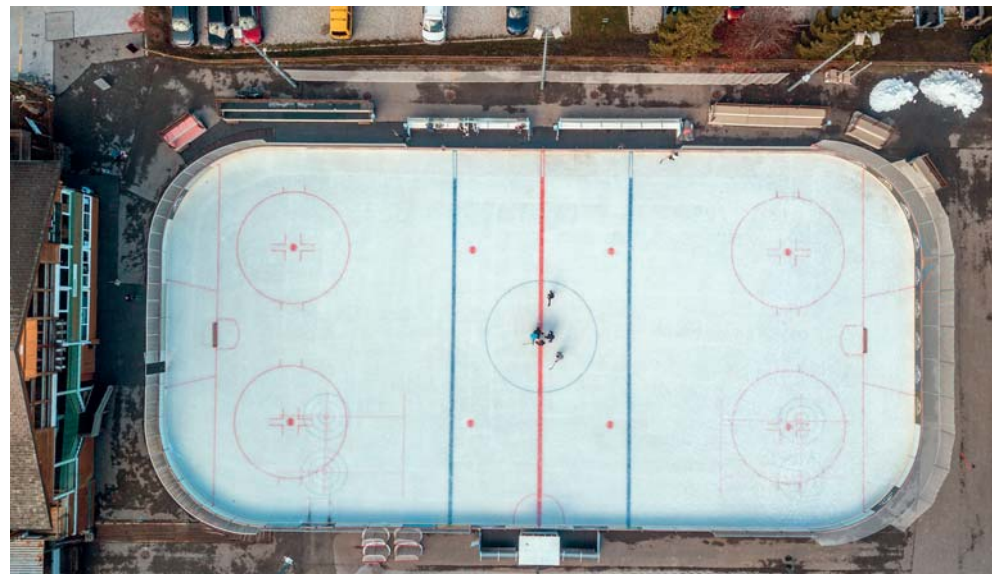
Il est l'heure d'aller chercher vos patins à la cave: la patinoire vous attend dès fin octobre

À Nendaz, le mardi 31 octobre, plein d'animations et