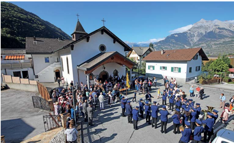
L'Echo du Mont a accueilli les fidèles pour l'apéro après la messe.