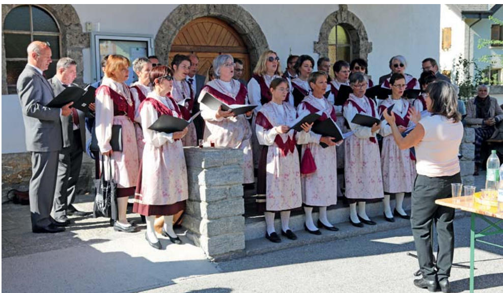
Après la verrée, le Muguet d'Aproz a donné une aubade.