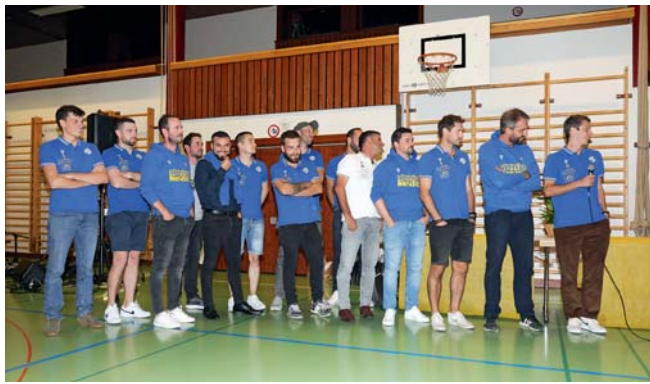
Le FC Printse-Nendaz.