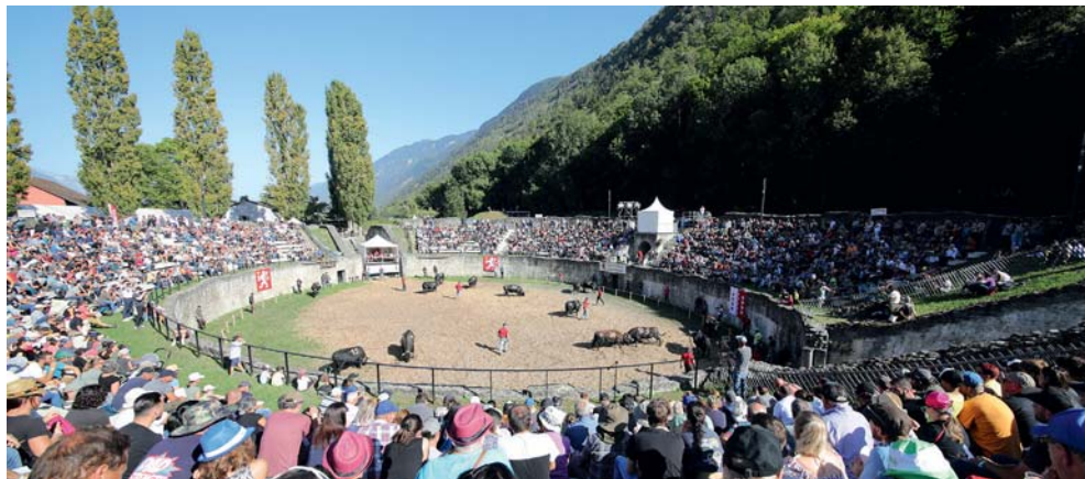
Le dimanche 1 er octobre, il y avait foule dans l'amphithéâtre.