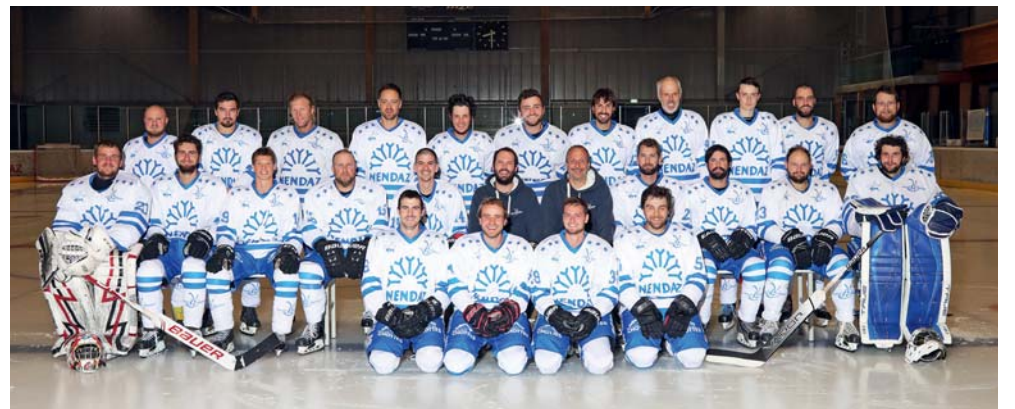
La Une de Nendaz, fin prête pour la saison 2023-2024.