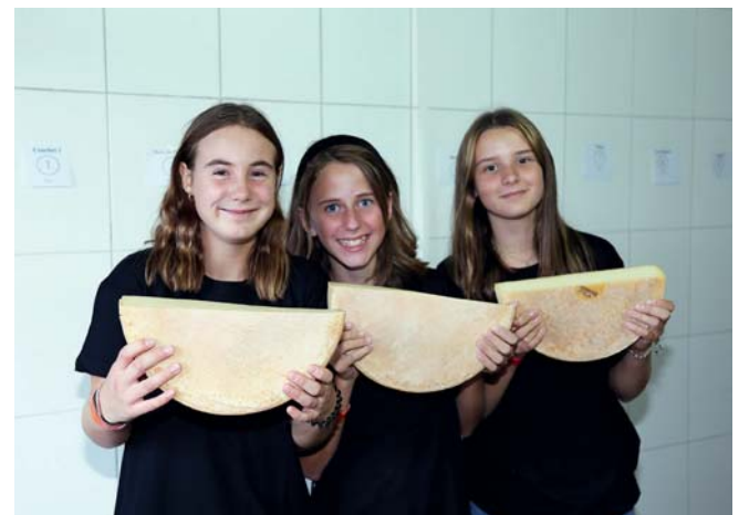
Les ravitailleuses.