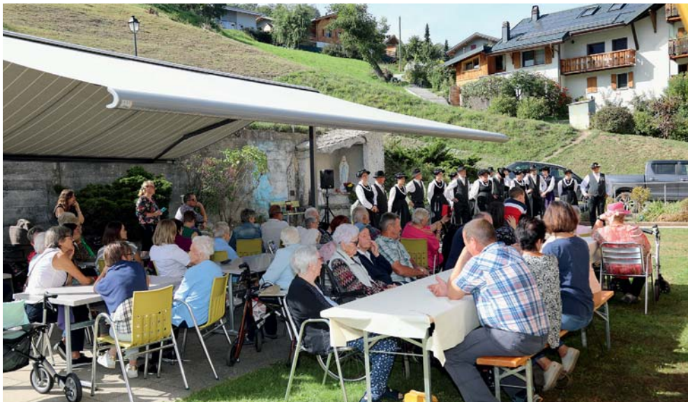
Le 30 septembre, dans les jardins du foyer, les familles sont venues fêter avec leur aïeul.