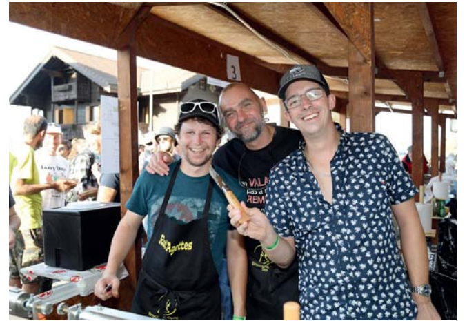
Y a de l'ambiance chez les bénévoles raclleurs.