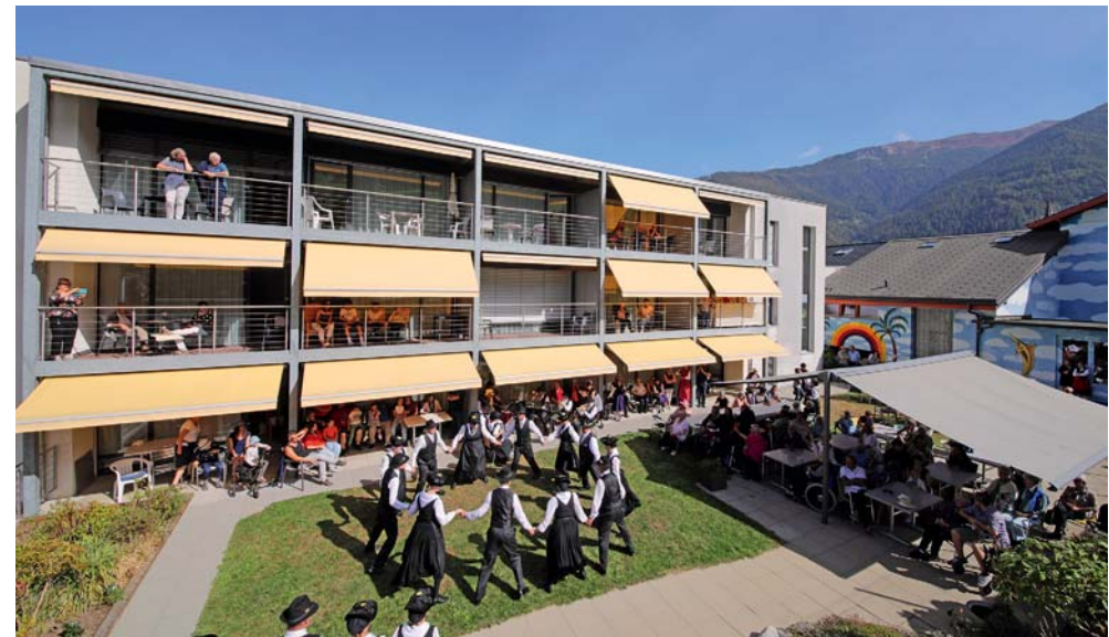
Ej'Ecochyoeü ont animé l'après-midi de leurs danses et de leur musique.