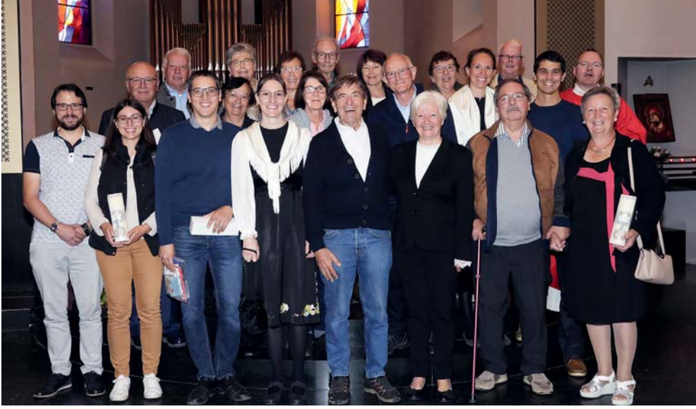
Après la messe, la tradition veut qu'on invite les jubilaires de mariage (de 5 en 5 ans) à poser pour la photo souvenir: de 5 à 50 ans!