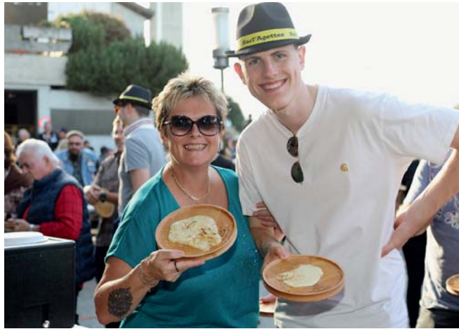
Fiers de poser avec leur raclette sur l'assiette en bois.