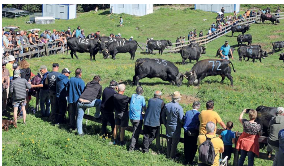
Combyre: Parade (25) contre Cobra (72).