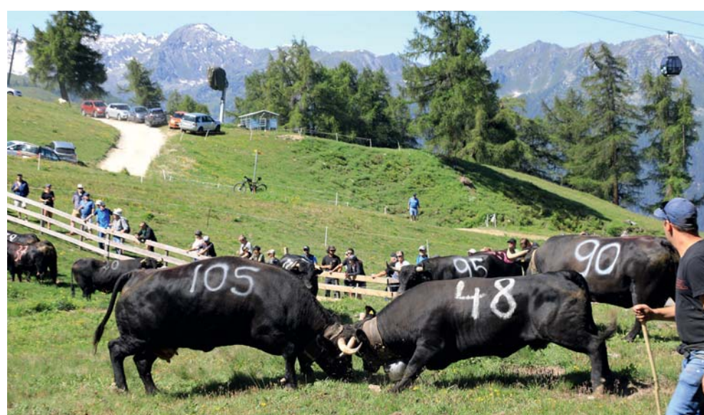
Combyre: Bijoux (105) et Joleen (48) luttent devant Zita (90), reine d'alpage 2022.