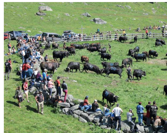
Tortin: les passionnés sont présents.