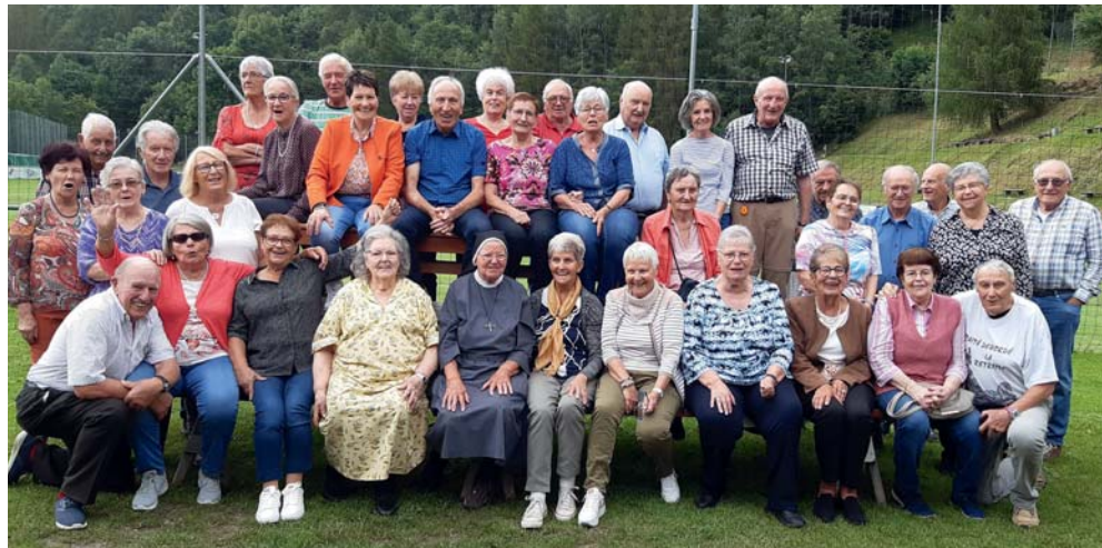
Texte: un participant

C'est ce qu'ont pensé les 42 joyeux octogénaires - zut, il manquait un - présents aux Grangettes le vendredi 30 juin. Dès 10h30 une belle ambiance s'installait, les bavardages et autres échanges allaient bon train autour de l'apéro. À 12h précises « Les trois petits cochons » traiteur du jour nous présentait son somptueux buffet. Jacqueline a dû calmer les impatiences,