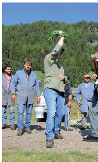
Tortin: la bénédiction.