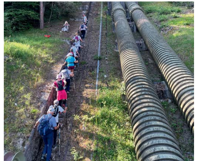
En plein effort, à la conquête d'une très longue volée de marches.