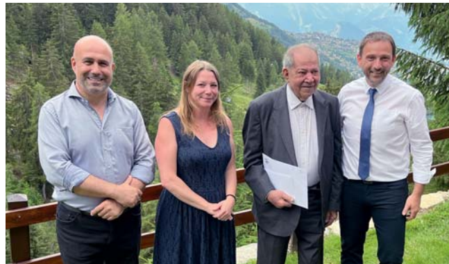
Texte: ta famille