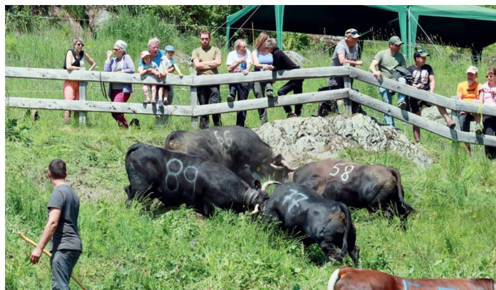
Siviez: Thenis (89) et Bagherra (77) luttent en même temps que Belonne (66) et Baltique (58).