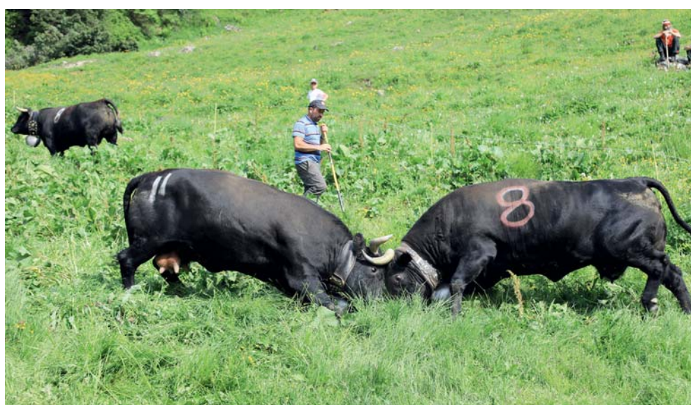
Novelli: la 11 de Sauthier contre la 8 de Brantschen.