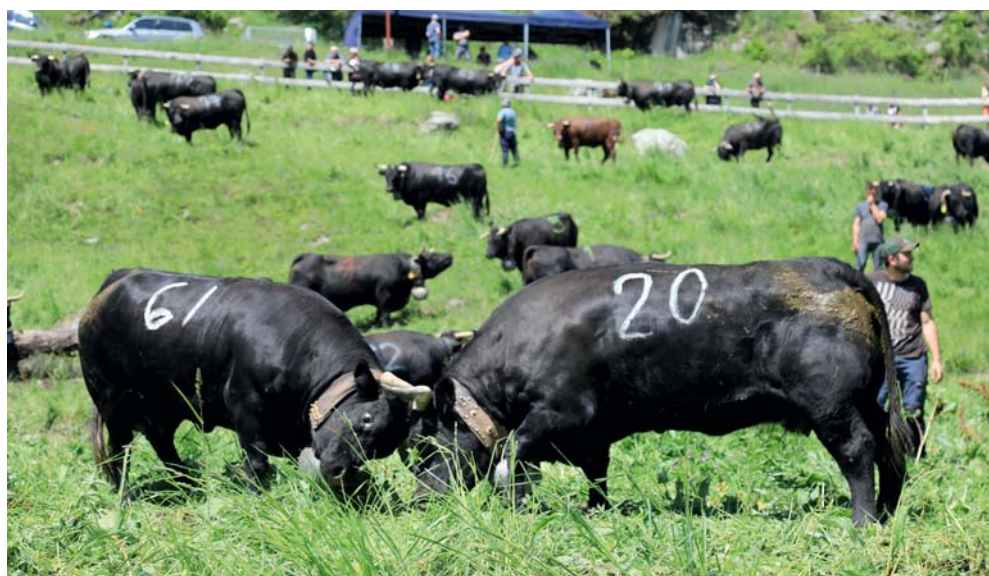
Siviez: Vipère (61) et Cérés (20).