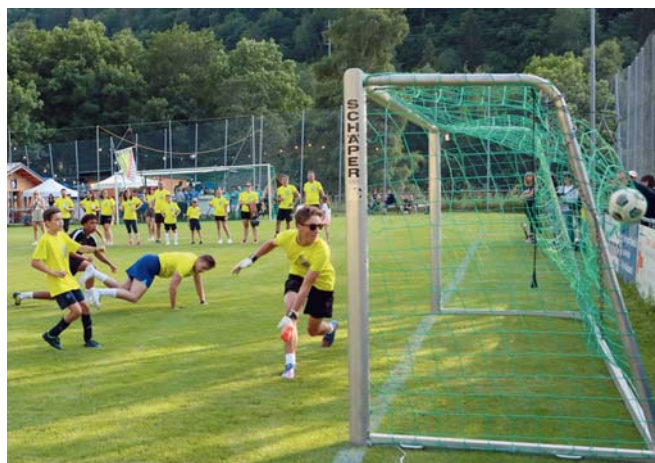
Zut, il est dedans...