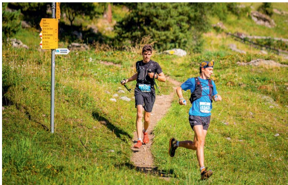
Le Nendaz Trail fête ses 10 ans le 26 août. Une nouveauté est proposée pour l'occasion : une épreuve relais sur le parcours de 30 kilomètres.

Le Tour des Stations passera par Nendaz le 5 août prochain. Il est connu loin à la ronde grâce à son parcours Ultrafondo proposant le dénivelé de l'Everest à parcourir en une journée sur 242 kilomètres, soit une pente moyenne de 3.7% avec un passage par les plus belles stations et cols valaisans. Il propose par ailleurs cinq autres parcours, ce qui offre à chacun l'occasion de relever un challenge à son niveau. Nendaz organise un grand ravitaillement sur la place de la télécabine où la majorité des coureurs passeront entre 11h et 13h. Plus d'informations sur www.tourdesstations.ch