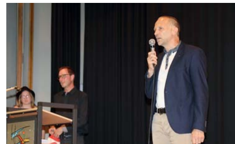
L'inspecteur a pris la parole pour féliciter les élèves et leur souhaiter bon vent.