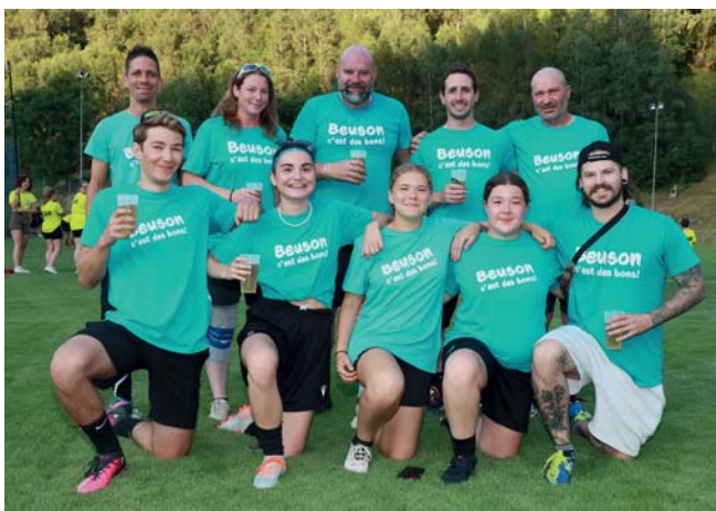
L'équipe de Beuson. | Photo Guillermin