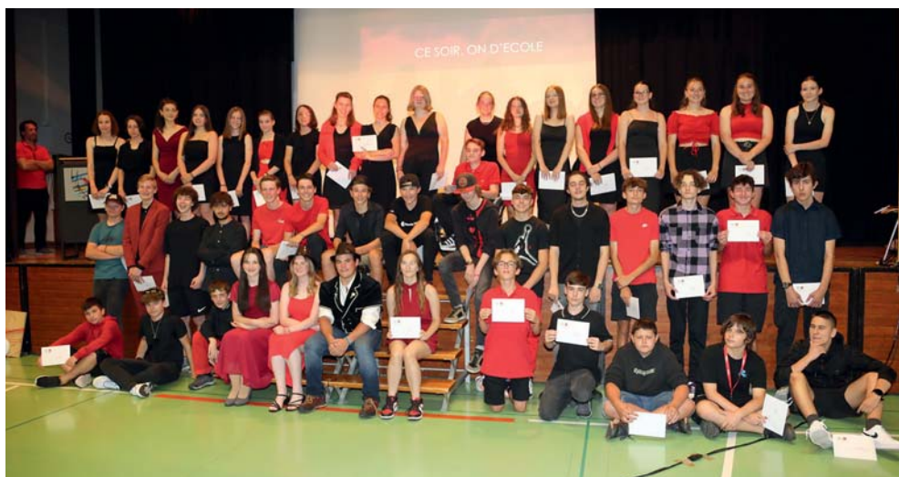
Les élèves du cycle de Basse-Nendaz, fiers de présenter le diplôme remis.