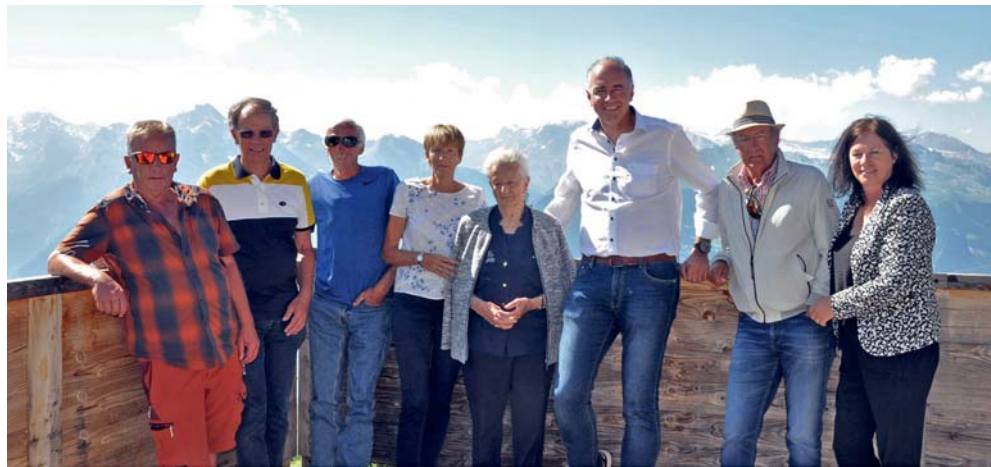
Texte: Jean-Maurice, le « cacani » de la famille

Notre chère Mariette a marqué son anniversaire d'une rencontre conviviale, toute de simplicité, au Restaurant Mont-Rouge, au sommet de la Télécabine des Mayens. Entourée de ses enfants et conjoints, petits-enfants, arrière-petits-enfants et des derniers survivants de sa fratrie, elle a célébré son anniversaire avec sa retenue, sa discrétion et sa disponibilité habituelles.