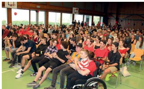
Parents et jeunes, tout le monde était là.