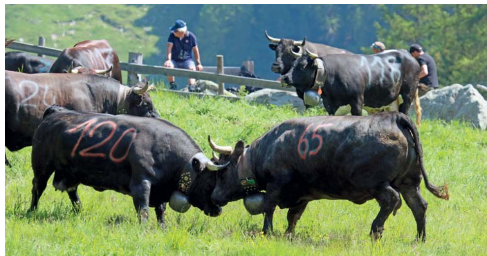
Tortin: Nina (65) et Vigousse (120) ont longuement lutté!