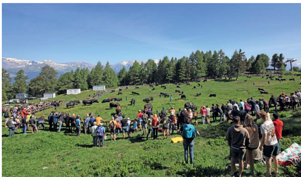
A Combyre, beaucoup de monde pour passer une belle journée ensoleillée.