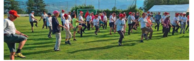
Échauffement pour tous sur le terrain du stade de Chaillen avant la grimpe des escaliers.

En encourageant les aînés à maintenir une activité physique régulière et à prendre soin de leur équilibre, les Trotteurs de la Printze démontrent, semaine après semaine, que l'âge n'est pas un obstacle pour vivre pleinement et profiter des joies de la randonnée et des balades. Ils apportent ainsi la preuve qu'un mode de vie actif contribue grandement au bien-être et à l'épanouissement de chacun.